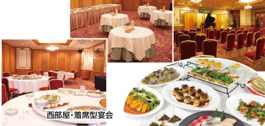
ホテルこだわりの宴会料理